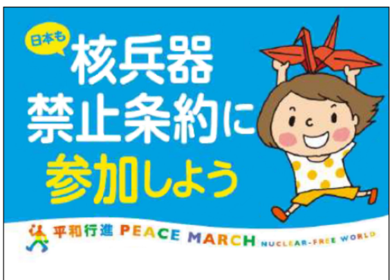
(上)行進フラッグ 1,500円 (縦50cm×横69cm 左側棒縫製3cm)