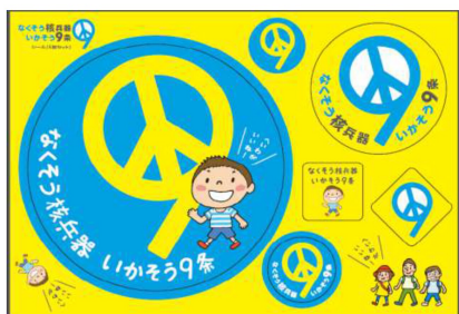
(右) ペナント 1,000円